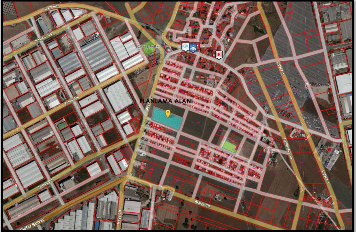
Şekil 1: Planlama Alanının Bölge İçerisindeki Konumu

Bursa İli, Nilüfer İlçesi, Minareli Çavuş Mahallesinde bulunan yaklaşık 5159 m 2 büyüklüğünde olan planlama alanı yakın çevresinde ağırlıklı olarak konut alanları ve donatı alanları bulunmaktadır.