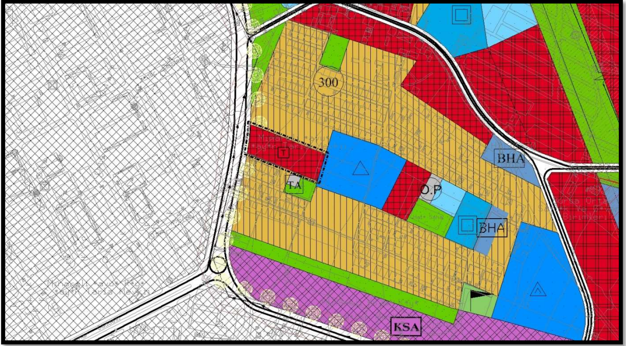
Şekil 5: 4959 Ada 2 Sayılı Parsele İlişkin 1/5000 Ölçekli Nazım İmar Planı Tadilatı