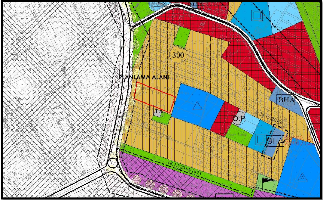
Şekil 4:1/5000 ölçekli Nazım İmar Planı Durumu